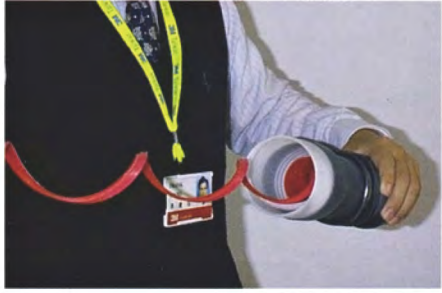
1. 安裝前先將紅色支撐管拉掉