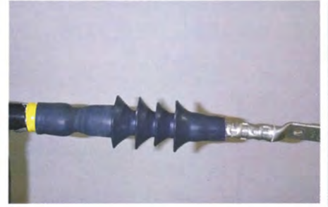
3. 拉完支撐管後，安裝完成