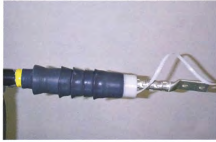
2. 將QT-III定位後拉掉白色支撐管